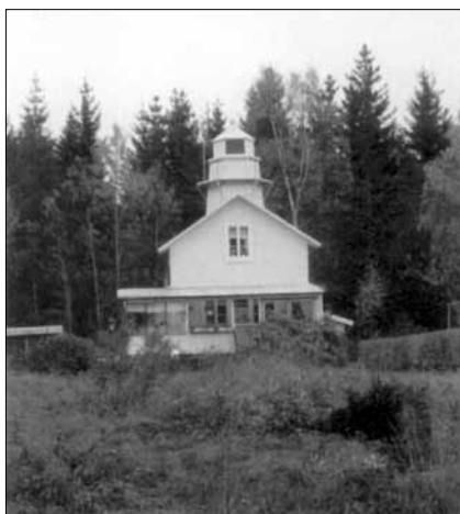
Gullsjö övre, tillika fyrvaktarbostad.

fande Gullsjö: För inseglingen till Mariestad uppfördes år 1902 på ett område tillhörande egendomen Sjöberg två linjefyrar, varav den norra bestod av ett vitmålat böningshus med torn på gaveln. C:a 150 meter söder därom uppfördes ett sexkantigt vitt torn som ledfyr. Båda voro färdiga på hösten samma år och tändes första gången