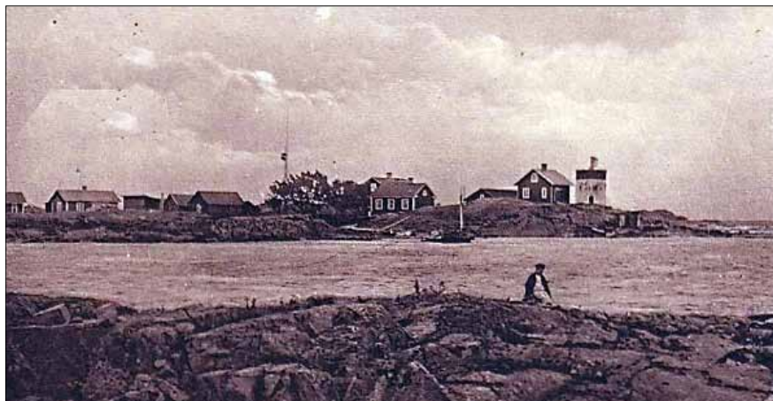
Svartklubbens fyrplats, vykort