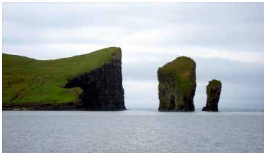
Klippformationer på väg till Mykines

Två svenskättlingar från Minnesota i USA, ett par från Spanien, samt en entusiastisk fågelskådare från England.