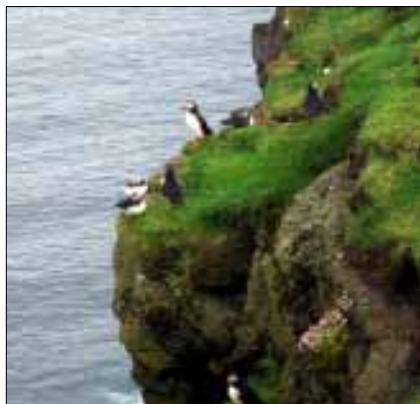
Lunnefåglar på Mykines

Fyren på Mykines byggdes redan år 1909 och står kraftigt stagad för att kunna stå emot Nordsjöns hårda väder. Vandringen tillbaka till båten gick lite snabbare, men det är ju krävande för både ben och knän även när det går utför. På båten tillbaka kan jag konstatera att det är många olika nationaliteter som finner intresse i att besöka den vackra klippön Mykines.