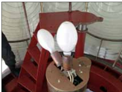
Fyrlampor på Bordan

Bussresan från flygplatsen i Vagar till Torshavn på ön Streymoy tar knappt en timme. Mellan öarna åker man genom en tunnel som är nästan 5 km lång. När tunneln är passerad hade dimman lättat och jag skådar en fantastiskt vacker vy. Öppna vidder med rik grönska, men utan träd. Från de mer höglänta delarna av vägen slingrar sig regnvattnet kraftfullt från bergen. Fären går och betar i dikesrenen och trafiken rör sig lugnt framåt utan stress. Ett för ögat njutbart sceneri välkomnar mig till Färöarna.