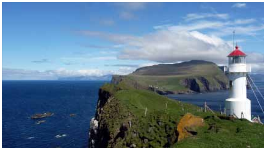
Fyren på Mykines, Färöarnas västligaste utpost