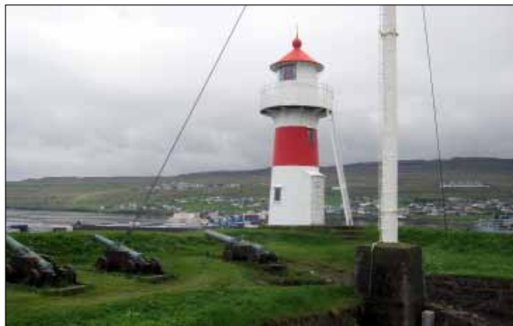
Fyren i inloppet till Torshavn

När bussen närmade sig Torshavn börjar dimman att tätna. Sikten är begränsad till några få meter. Jag förundras över hur bussföraren och övrig trafik kan ta sig fram i staden i den täta dimman. Vädret är oberäkneligt på Färöarna och jag inser att det inte är möjligt att besöka fyren på Nolsöy denna dag. För att komma till fyren Bordan på Nolsöy är det först färja från Torshavn som tar 20 minuter. Därefter en vandring i starkt stigande terräng över höglandet på små slingrande stigar. En vandring som tar drygt 3 timmar i vardera riktningen.