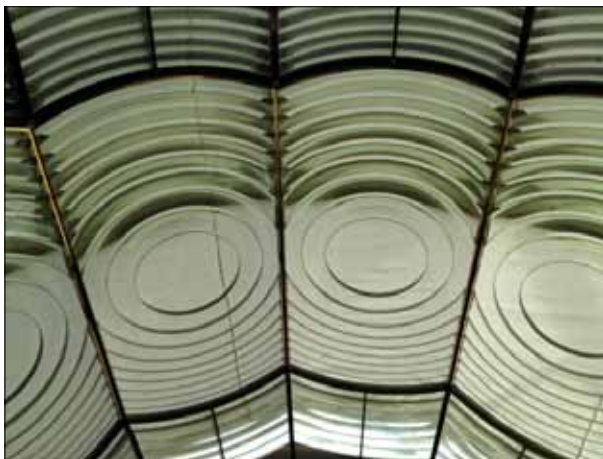
Bordans fyrlins, den största i hela Europa