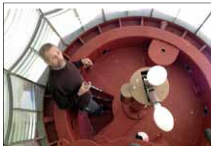
Inne i linsen på Bordan