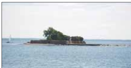
Grimskär sett från slottet. Träden har vuxit i höjden.