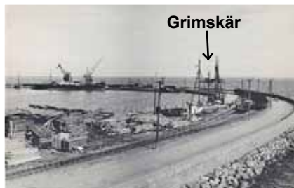
Kalmar hamn med Tjärhovet år 1922 med Grimskär i bakgrunden. Vy mot söder.

År 1953 såldes byggnaderna. Inga byggnader finns idag kvar på Grimskär.