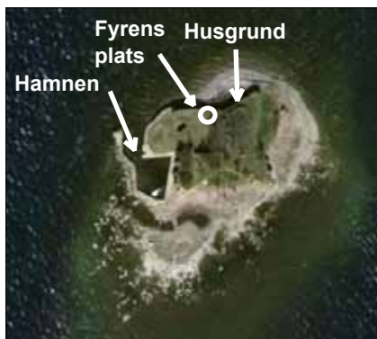
Satellitbild i nutid över Grimskär. Skansen mäter 60 meter diagonalt från spets till spets. Isskruning och stormar går hårt åt vallarna. Grundet utgörs av stenskravel.