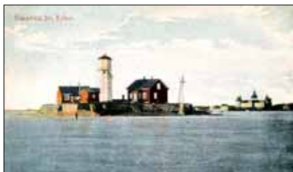
Två bilder från tiden 1884-1893. Fyrtoronet från år 1865 höjdes och målades vitt år 1884. Direktionsfyren på den norra stranden byggdes år 1880 och reus år 1893. På den övre vinterbilden ses en man gå på isen. Kalmar slott ses i bakgrunden.