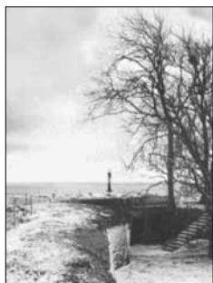
Kassunfyren Skansgrundet ligger cirka 200 m väst om Grimskär. Mellan de båda går farleden genom Kalmarsund.