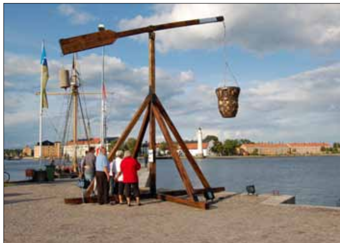
Vippfyren uppmonterad på kajen inför Sail Karlskrona

Onsdagen den 12 augusti transporterades och monterades vippfyren på plats på Kungsbron där Världsarvsporten är belägen under Sail Karlskrona som genomfördes 12-15 augusti i år. Vi valde att ljussätta själva korgen istället för att elda i den då det låg båtår i närheten. Fyren väckte stor uppmärksamhet och många besökare stannade till och tittade på den samt läste information vi satt om bygget av vippfyren samt lite historik om vippfyrar. Fyren fick stå kvar i några veckor efter evenemanget och vid nedmonteringen var det flera invånare som gärna sett att den fått stå kvar ännu längre. Nu ligger vippfyren nedmonterad för vinterförvaring.