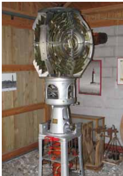
Den tidigare linsapparaten, numera klassad som museiföremål

Engelsmännen hade sitt huvudläger vid fyren och byggde en mindre fästning med försvarsvallar, skyttevärm och kanoner. Fort York kallade de sin anläggning. Runt fyrens sockel byggdes en kasemattkran av ansenligt format där soldaterna inkvarterades. En del av kasematten finns