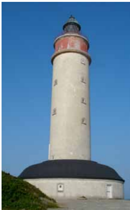
Fyrtornet med kasematten

1785 - 88 restes det första murade fyrtornet på Anholt, 30 meter högt med en öppen koledad brasa i toppen som år 1805 täcktes med en lanternin. En mindre fyrvaktarbostad fanns sedan tidigare vid fyren, den förbättrades också i början av 1800-talet. Så såg fyrplatsen ut när Napoleonkrigen började härja i Europa,