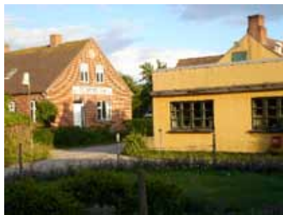
Några av husen i Anholt by

Anholt, med sitt centrala läge i Kattegatt, har under alla år varit fruktat för sina förrådiska sandrev. Redan 1560 tänktes den första fyrpannan på Anholt. På kunglig befallning och för att säkra farleden mellan Skagerrak och Östersjön upprättades öppna vedeldade fyrpannor på Skagen, Anholt, Kullen och Falsterbo. "Rigets Magt og Anseelse er mest udi Søen anliggendes" menade den danske kungen som den gången hette Frederik II. Fyrpannan på Anholt placerades på öns östra spets, där det föränderliga och