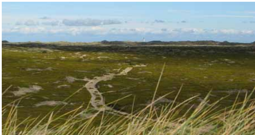
Ørkenen med fyren i fjärran

hände att kyrkfolket försvann i vågorna. Nu byggdes kyrka på Anholt och man fick också en egen präst stationerad på ön så småningom.