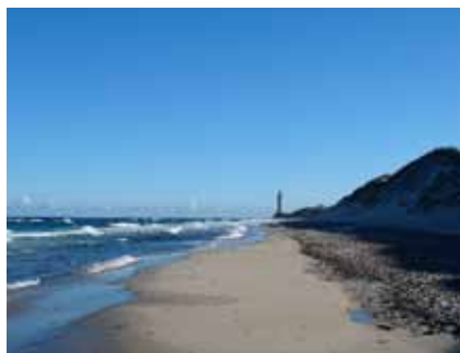
Nordstrand med Anholts fyr i öster

För att nå fyren krävs en fotvandring på nio kilometer från "civilisationen" på västra sidan av ön. En dagstur till fyren med skaffning i ryggsäcken och återkommande stopp för bad och begrundan på vägen, det är en lisa för själen och ett måste för den som mäktar med strapatsen. Ute vid fyren, på Totten, kan man beskåda en av Kattegatts största sälkolonier.