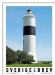
T.h. Långe Jan