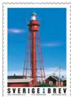
T.v. Pite Rönnskär

Vi på Fyrsällskapet var där och höll en kort dragning om Fyrsällskapet och fyror.